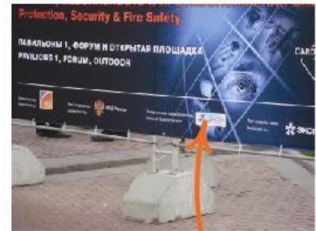
Логотип на всех носителях наружной рекламы выставки.