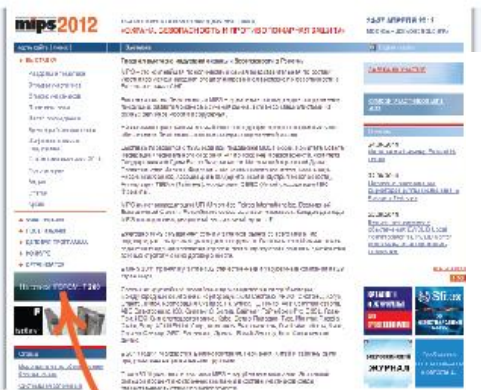
Размещение баннера. Сайт выставки.