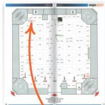
Путеводитель выставки. Тираж * 15 000. Логотип на плане выставки.