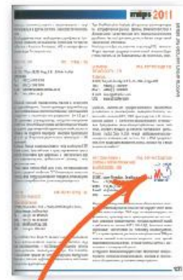
Каталог выставки. Логотип в тексте каталога.