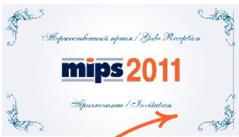
Билет на вечерний прием. 2 шт.