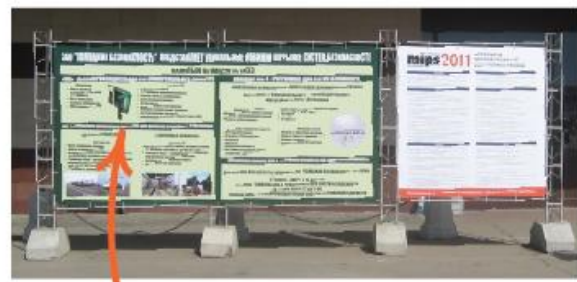
Рекламный баннер. 4 м² при входе в павильон 1 или "Форум"