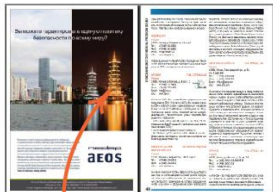
Каталог выставки. Рекламная полоса 1\1.