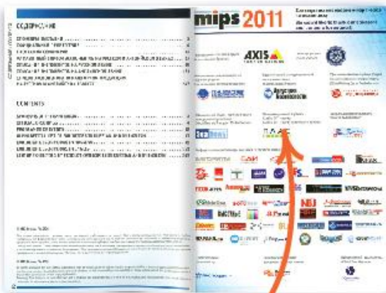
Каталог выставки. Логотип компании на странице благодарности.