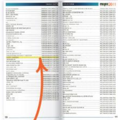
Путеводитель выставки. Выделение названия компании цветом в списке участников.